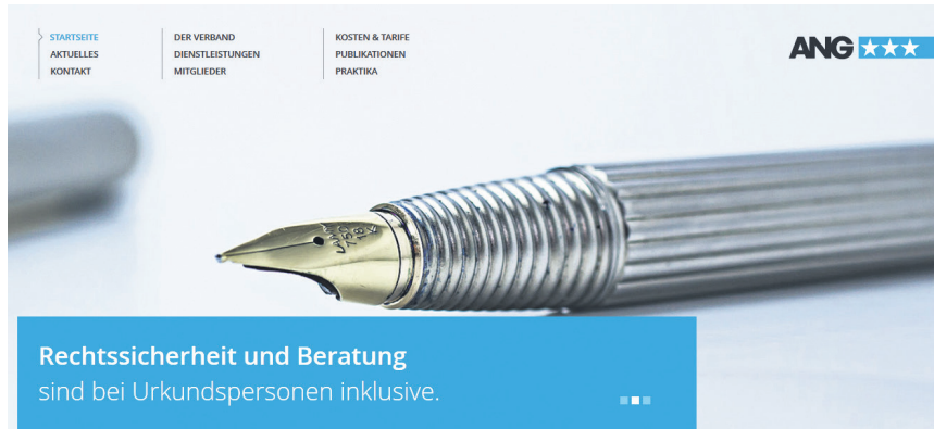
So präsentieren sich die aargauischen Urkundspersonen auf ihrer Website.

Bei der öffentlichen Beurkundung handelt es sich um ein besonderes Verfahren, bei welchem eine Urkundsperson rechtserhebliche Tatsachen oder rechtsgeschäftliche Erklärungen in der vom Staat geforderten Form und in dem dafür vorgesehenen Ablauf festhält. Die Form der öffentlichen Beurkundung ist für verschiedene Verträge und Erklärungen gesetzlich vorgeschrieben. So sind beispielsweise